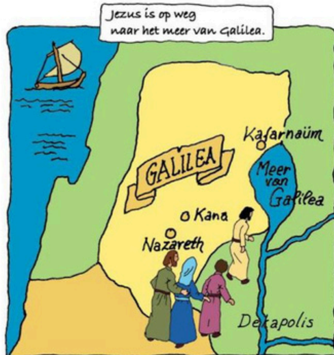
Jezus is op weg naar het meer van Galilea.