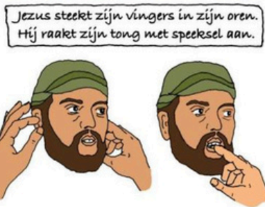
Jezus steekt zijn vingers in zijn oren. Hij raakt zijn tong met speeksel aan.