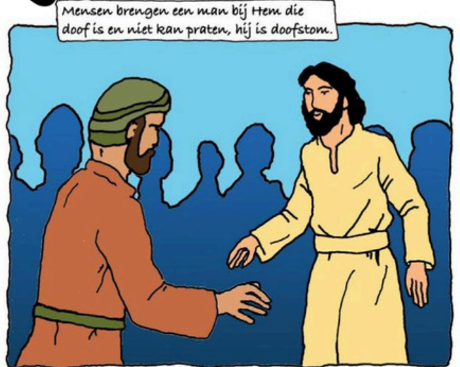
Mensen brengen een man bij Hem die doof is en niet kan praten, hij is doofstom.