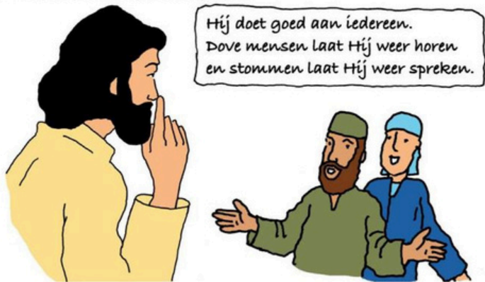
Hij doet goed aan iedereen. Dove mensen laat Hij weer horen en stommen laat Hij weer spreken.

Wat fijn als je goed kunt horen en goed kunt praten. Dat Jezus deze man geneest heeft een diepere betekenis. Hoe goed luisteren wij naar God en naar elkaar? Praten wij goed met God? Jezus wil ons van binnen genezen, zodat we beter kunnen luisteren naar het evangelie en beter bidden en ook beter spreken met elkaar en over elkaar.